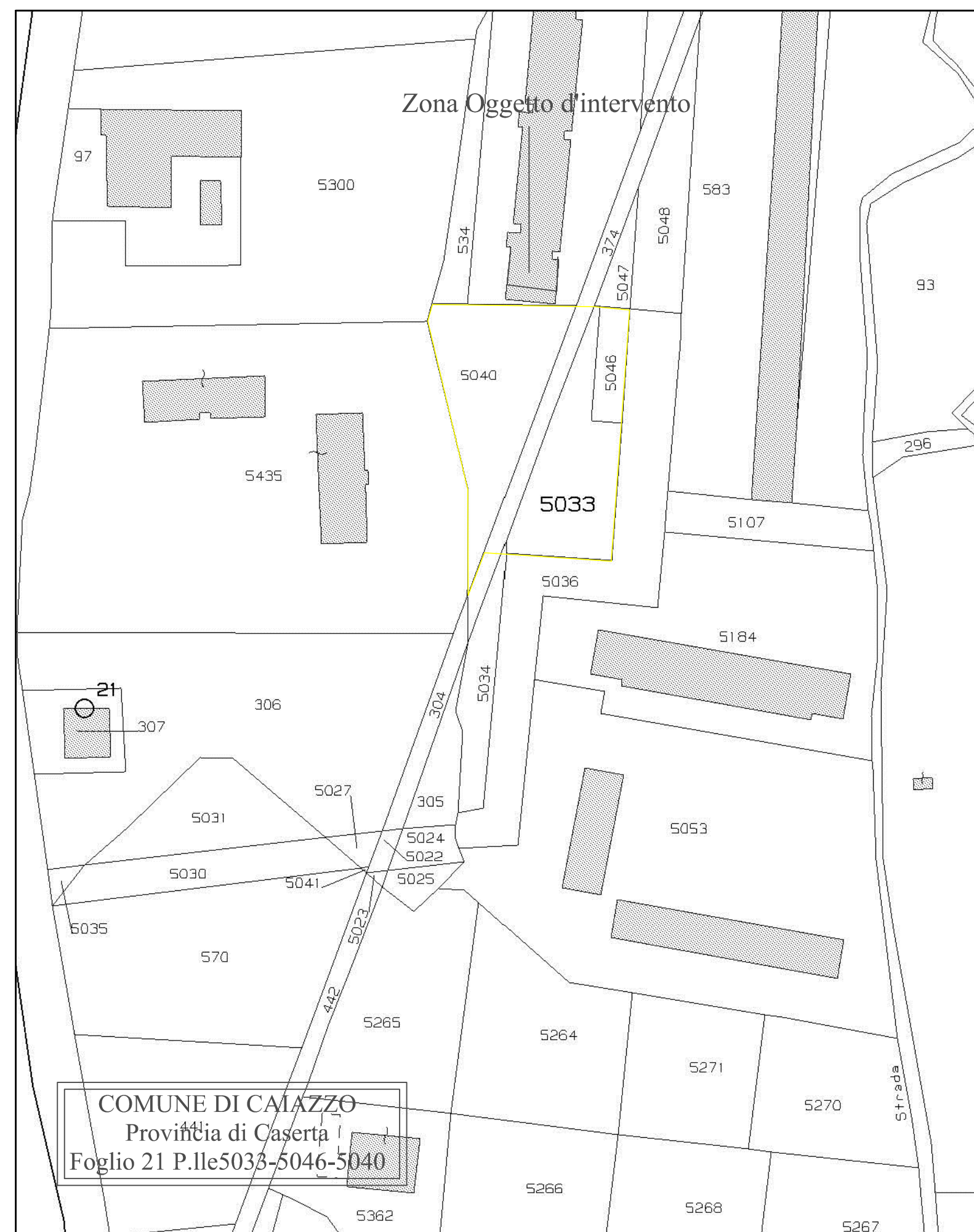
Stralcio Catastale scala 1/1000