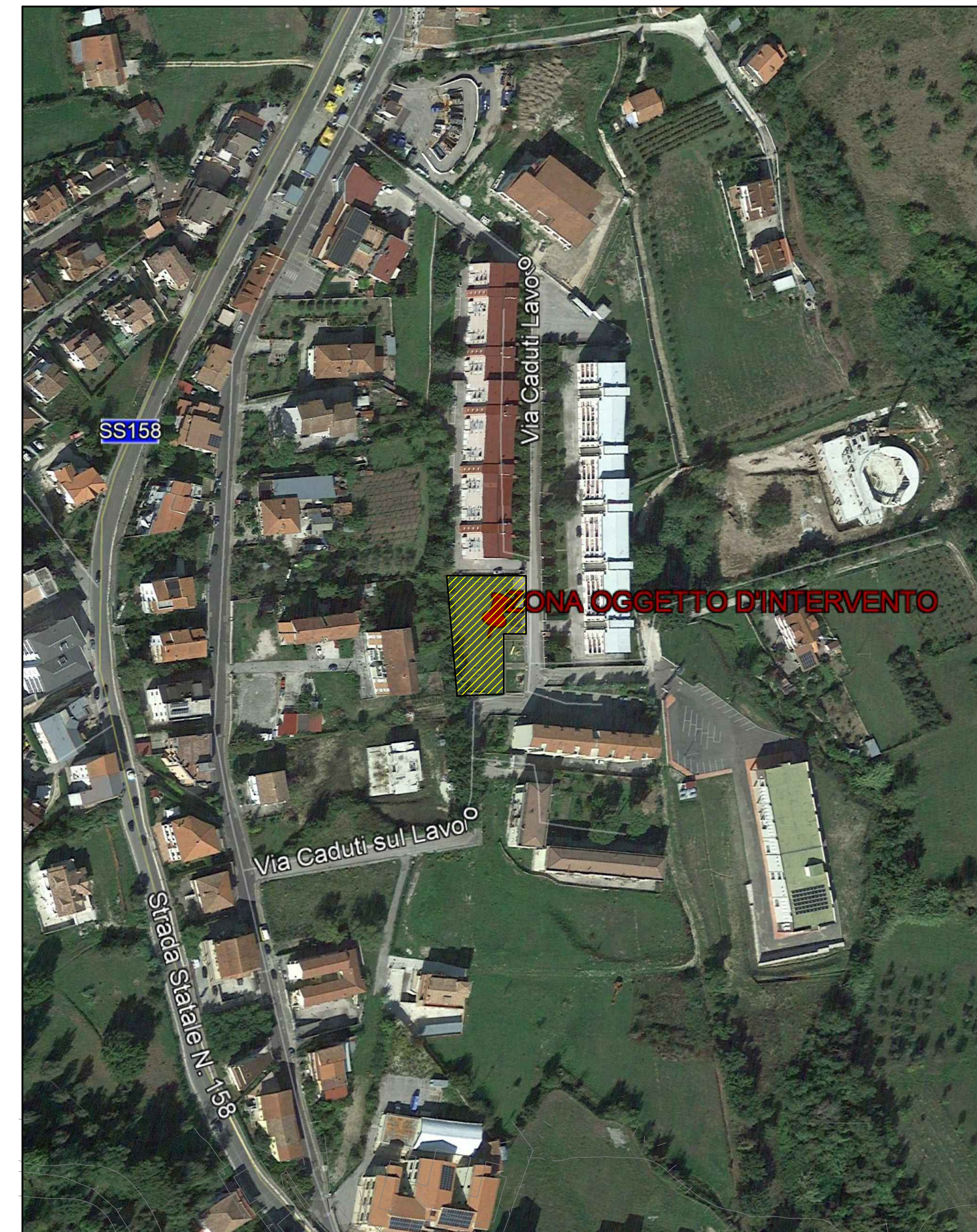
Localizzazione Satellitare scala 1/2000